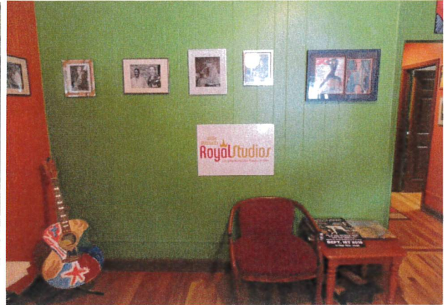
≪ウィリー-ミッチェル通りに位置するロイヤルスタジオ≫

1957年設立されたロイヤルスタジオはメンフィスソウルの歴史的に大きな足跡を残した。ハイレコードのホームでありアルグリーン、アンビーブルス近年ではローリングストーンズ、ブルーノマーズ等の偉大なるアーティストがレコーディングしてます。