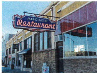
エルヴィスも通った.. アーケードレストラン