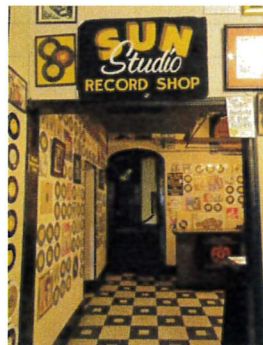
エルヴィスにゆかりの↑STAXやSUN STUDIO↑